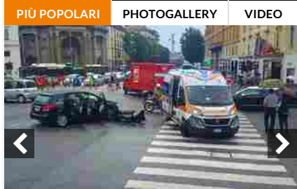
Bergamo, scontro tra due auto in Porta Nuova