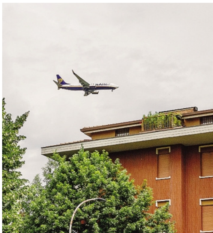
Un aereo sui tetti di Colognola

Troppi aerei e ancora troppo rumorosi: le rotte cambiano, ma i problemi restano e lo dimostrano i valori del monitoraggio mensile sui livelli di rumore che i comitati hanno presentato alla riunione, cui erano presenti anche i vertici di Sacbo e Ats e i rappresentanti di Enac ed Enav. Anche ad aprile i valori massimi registrati hanno superato i 68 decibel in alcune zone di Seriate, e ovunque tra Orio, Bagnatica e Bergamo - dove sono state posizionate le centraline - i valori hanno superato i 60 decibel. Tutte questioni che i comitati hanno posto di nuovo sul tavolo del prefetto, con la richiesta di abbassare il numero dei voli, soprattutto nelle ore notturne. Il prefetto ha assicurato che manterrà costante il canale aperto con il Governo, confermando che anche la Prefettura di Bergamo «continuerà a offrire massima attenzione alla questione, anche nel corso di prossime riunioni, durante le quali potrà essere condotta