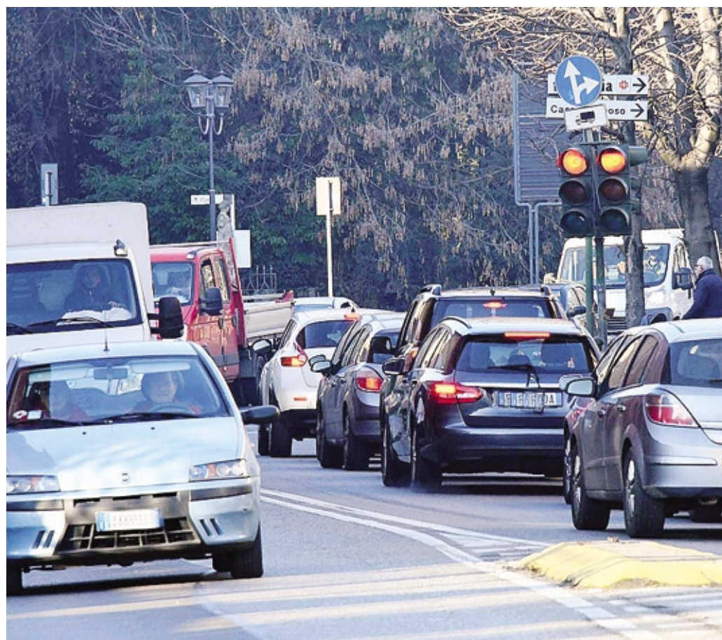
Traffico a Verdello: si allungano i tempi per realizzare il progetto della nuova circonvallazione est