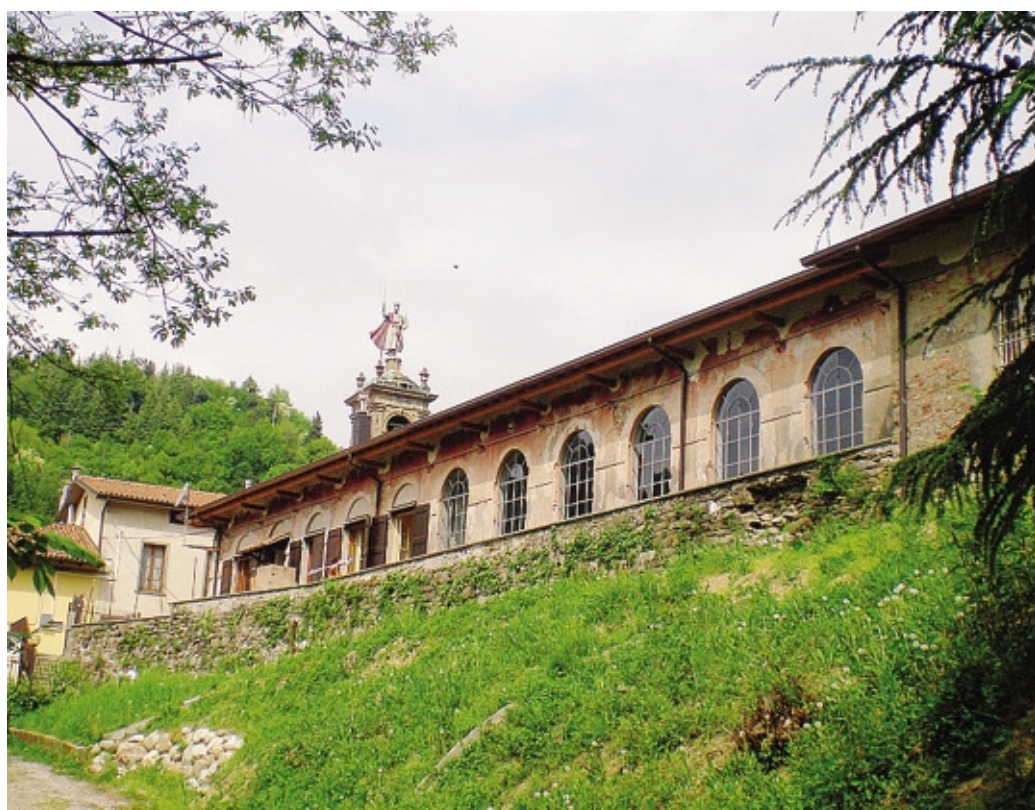
L'edificio che ospitava la filanda, proprio accanto all'abbazia di Pontida